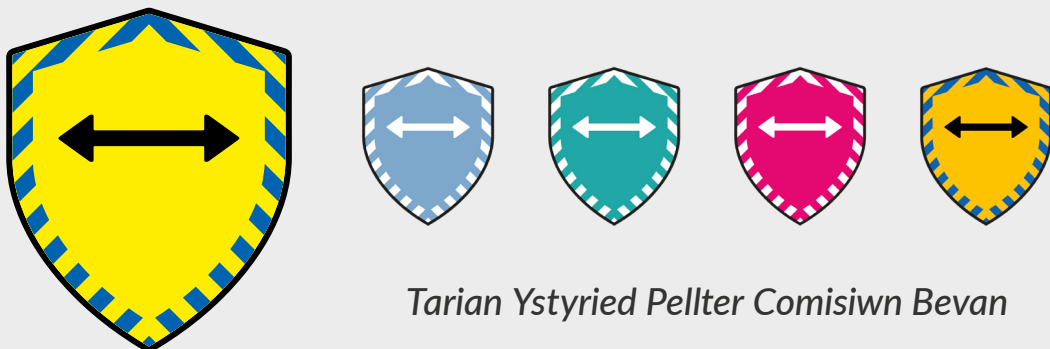
Tarian Ystyried Pellter Comisiwn Bevan

Dyla unigolion fod yn ymwybodol o'r ymgyrch 'Ymwybyddiaeth o bellter': Linc → , sy'n galluogi i unigolion a sefydliadau annog pellter parhaus yn gwrtais a pharchu gofod cymdeithasol unigol (ar eu cyfer hwy eu hunain ac eraill).